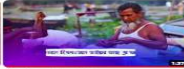
জটিকা সংরক্ষণ সমস্যা-২০২৪ 130 views · 3 weeks ago