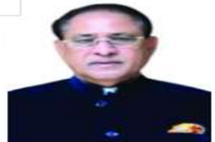
জনাব মোঃ আব্দুর রহমান, এমপি মৎস্য ও প্রাণিসম্পদ মন্ত্রণালয় বিস্তারিত