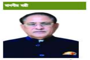
জনাব মোঃ আব্দুর রহমান, এমপি মৎস্য ও প্রাণিসম্পদ মন্ত্রণালয় বিস্তারিত