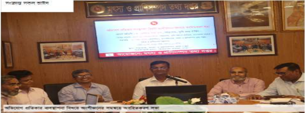
অভিযোগ প্রতিকার ব্যবস্থাপনা বিষয়ে অংশীজনের সমন্বয়ে অবহিতকরণ সভা 1 / 10 Start Stop (1)