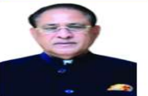
জনাব মোঃ আব্দুর রহমান, এমপি মৎস্য ও প্রাণিসম্পদ মন্ত্রণালয় বিকল্পিত