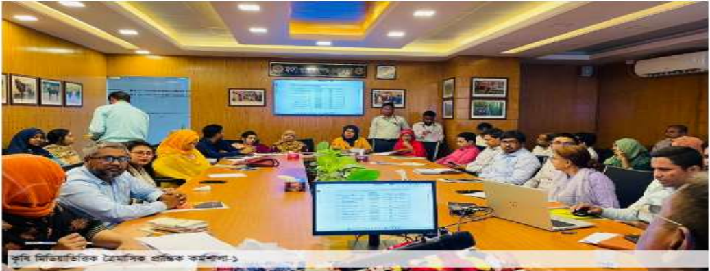
কৃষি মন্ত্রিসভার ১০৯তম বৈঠক, ১৩ জানুয়ারি ২০১৬