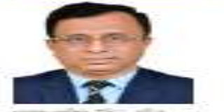
সেবা ও প্রতিদান করা সত্ত্বেও বোর্ডিং