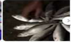
জটিকা ইলিশ বাঁচলে পড়ে 22 views · 3 years ago