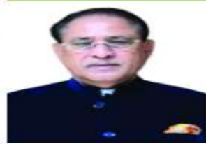
জনাব মোঃ আন্বুর রহমান, এমপি মৎস্য ও প্রাণিসম্পদ মন্ত্রণালয় বিস্তারিত