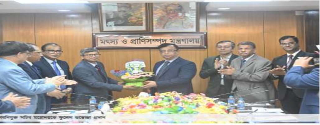
দাবনিয়ুক্ত সচিব মহোদয়কে ফুলের অর্পণের ধরন