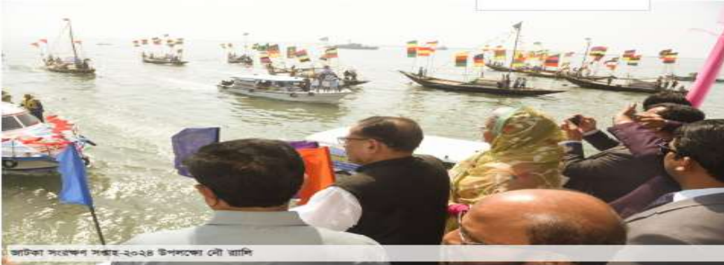
জাটকা সংরক্ষণ সড়ক-২০২৪ উপলক্ষ্যে নৌ যাত্রা