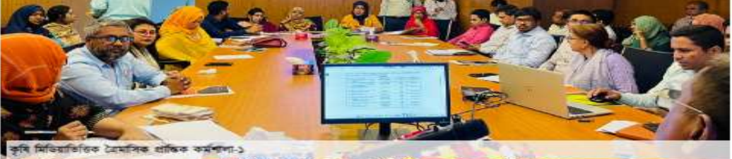
কৃষি মন্ত্রিসভার ১০৯তম বৈঠক, ১৩ জানুয়ারি ২০১৬