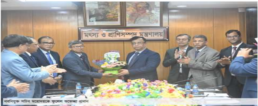
দাবনিয়ুক্ত সচিব মহোদয়কে ফুলের অর্পণের ধরন