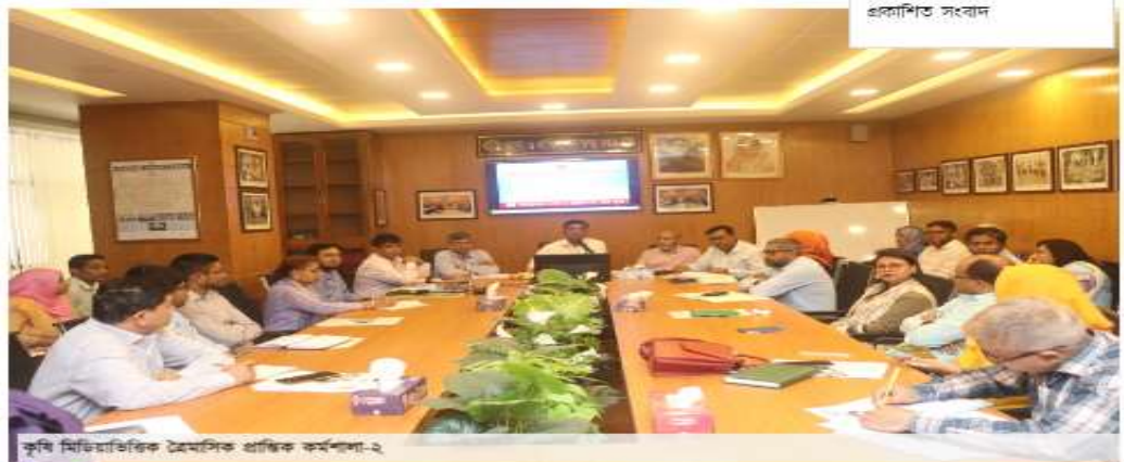
কৃষি মিডিয়াভিত্তিক ত্রৈমাসিক প্রাথমিক কর্মশালা-২