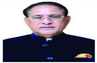
জনাব মোঃ আব্দুর রহমান, এমপি মৎস্য ও প্রাণিসম্পদ মন্ত্রণালয় বিত্তারিত