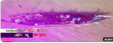
শেঁকৈ জাল নিতুলে "বিশেষ কৃষি: অপারেশন"-২০২৪ 80 views · 2 months ago