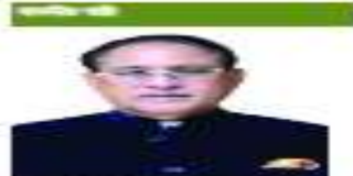
সেবা ও প্রতিদান করা সত্ত্বেও বোর্ডিং

সেবা ও প্রতিদান করা সত্ত্বেও বোর্ডিং 2028-02-29 346 348 349 350 352 353 345 351 356