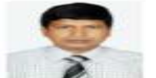
সেবা ও প্রতিদান করা সত্ত্বেও বোর্ডিং